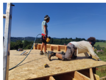
Coupe et fixation de l'OSB