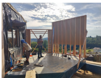
Levage du mur