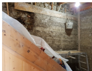
Béton de lavande banché sur la façade nord