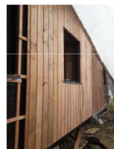
Pose d'un bardage