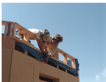
Construction des acrotères