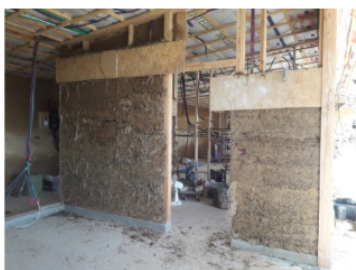
Construction d'une cloison en terre/paille