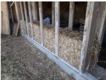
Isolation GREB en bottes de paille