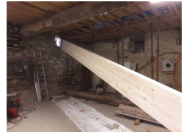
Changement d'une poutre avec un palan