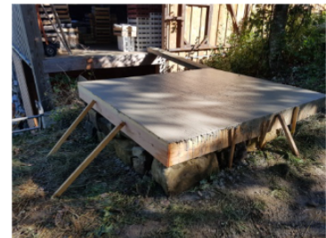
Dalle béton sur pierre sèche