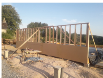
Construction d'une ossature simple