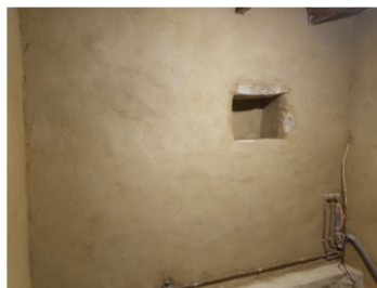
Après projection et lissage