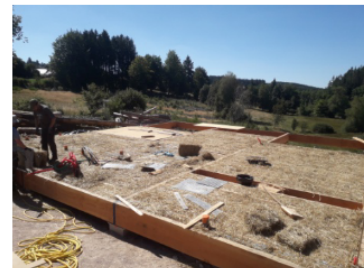
Isolation d'une dalle en botte de paille