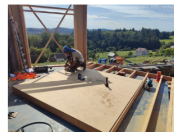
Agepan pare pluie et contre ventant