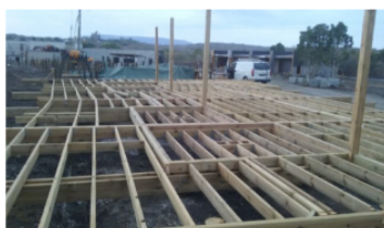
Construction depuis les pieux...