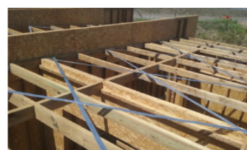
...jusqu'à la charpente