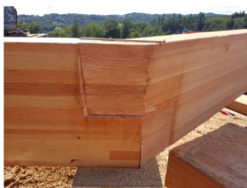
Traçages et coupe à la tronçonneuse