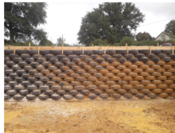
Projection de torchis