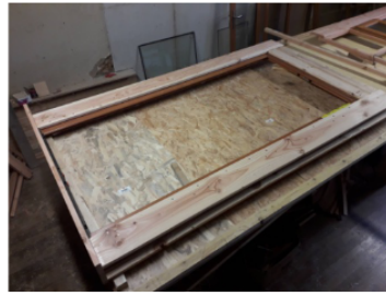
Fabrication d'un cadre de porte pour une yourte