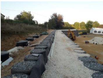
Pose de pneus pour un earthship