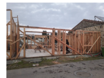
Construction d'une double ossature GREB