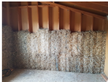
Isolation en bottes de paille pour une ossature simple