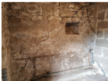
Enduit chaux/sable avant décroûtage