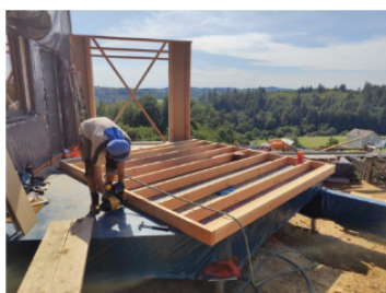
Construction de l'ossature