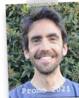
Avent Grange Avenir & Bâti

Mon objectif est d'associer la réalisation d' audits énergétiques à la mise en œuvre sur chantier d'isolants biosourcés. Je réalise ce projet avec l'entreprise Avenir & Bâti, localisée dans la combe de Savoie (St Pierre d'Albigny).